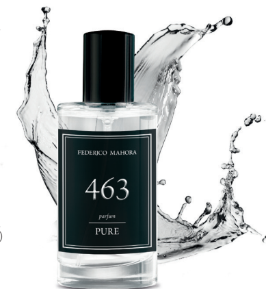
PARFÉM Objem: 50ml parfémy Parfemace: 20%

Noty hlavy: bergamot, ananas, listy černého rybízu Noty srdce: vodní tóny, kašmírové dřevo, kardamom Noty základu: pačule, santalové dřevo, pižmo