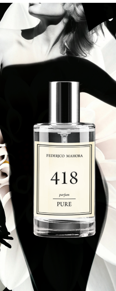
PARFÉM Objem: 50ml parfémy Parfemace: 20%

Katalogová cena 395,00 Kč 7.900,00 Kč/1l